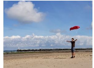
Bewoner Oak Tree huis

Door de toegenomen diversiteit in de cohousing voorzien wij daadwerkelijke inclusie .