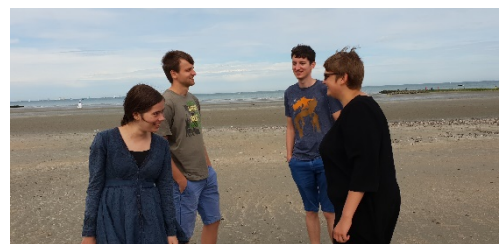
Bewoners eerste Oak Tree huis

Tot onze doelgroep behoren personen met ASS en/of een licht verstandelijke en/of motorische beperking en/of een psychische kwetsbaarheid of een ander chronisch ziektebeeld (bijvoorbeeld fibromyalgie, epilepsie...). Ze zijn te zelfstandig om hun dagen te slijten in een voorziening of tehuis met voltijdse zorg. Maar ze hebben wel een ondersteuningsvraag, waardoor volledig zelfstandig wonen een stap te ver is.